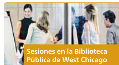
Sesiones en la Biblioteca Pública de West Chicago