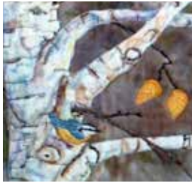
Trabajo de arte de cocha por Sharon Malec

exhibición destacada estará disponible para el mes de febrero , con detalles de la Recepción de Apertura encontrada en la