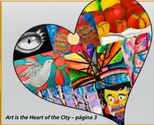
Art is the Heart of the City – página 3