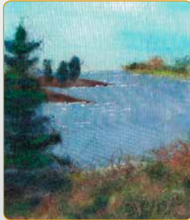
Fiber Adventures por Patty Koenigsaecker.

2 Recepción de Apertura para Fiber Adventures Gallery 200, 103 West Washington Street 6:00 – 9:00 p.m.