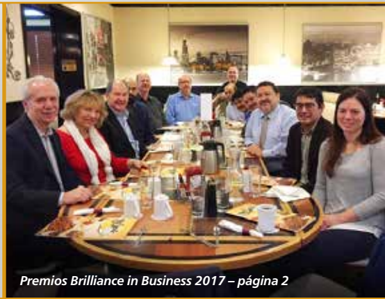
Premios Brilliance in Business 2017 – página 2