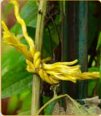
Under Construction por Judith Horsley.

5 Recepción de Apertura para Under Construction Gallery 200, 103 West Washington Street 6:00 – 9:00 p.m.