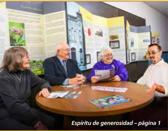
Espíritu de generosidad – página 1